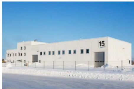
Сервисная станция аварийно- спасательных средств «Viking Life saving equipment»