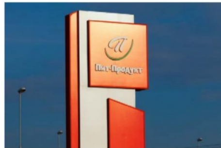
Мясоперерабатывающий завод Atria под торговой маркой «Пит Продукт»