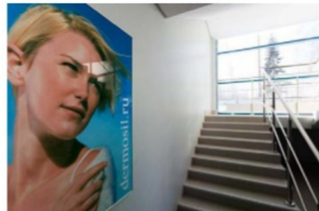
Предприятие по упаковке и хранению косметической продукции "Dermosil"