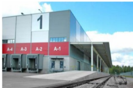
Логистический Центр класса «А» ГОРИГО / Эвли Пропертиз